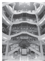
ダイヤモンド号 エントランスホール

〒105-0013 東京都港区浜松町1-20-8 山市ビル4階 観光庁長官登録旅行業第587号